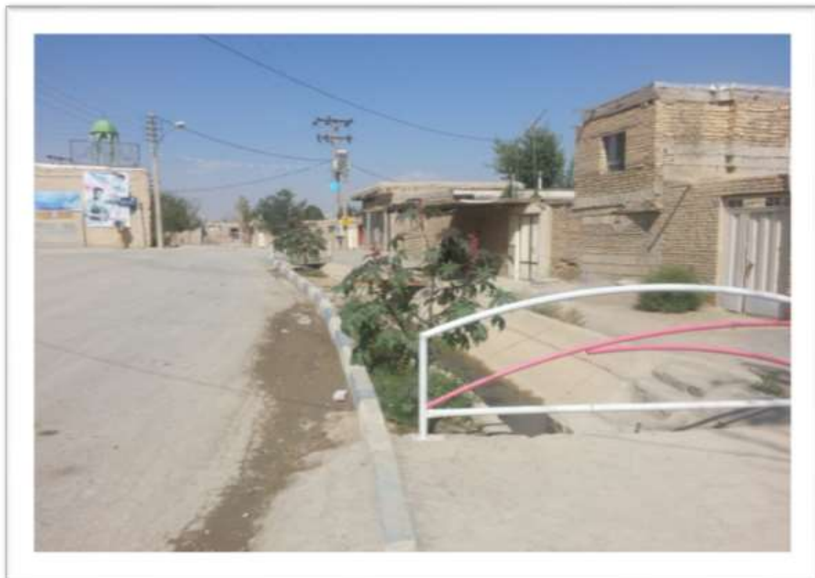
ج- طول جاده روستا: طول جاده آسفalte ۲۰۰۰ مترمی باشد. ۳۰۰۰ متر طول معابر خاکی میباشد.