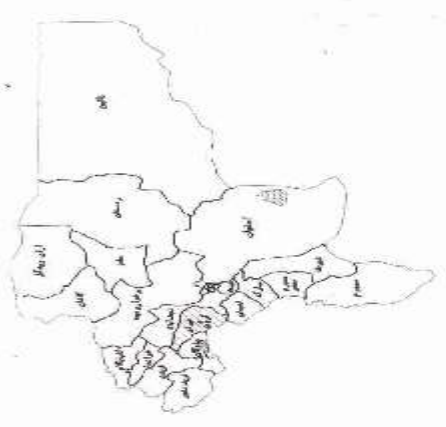
بخش های شمالی از تقاطع کنگ و دهنستان