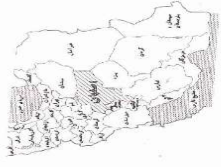
بخش های جنوبی از تقاطع کنگ و دهنستان